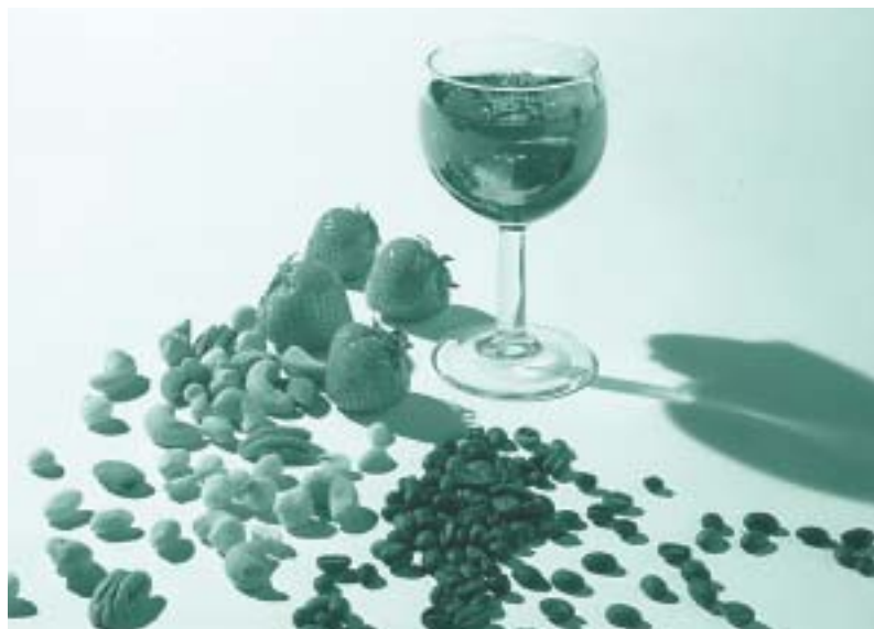
Styreen komt als natuurlijk product voor in voedsel als aardbeien, bonen, noten, bier, wijn en koffie

Zoals gezegd bestaat EPS voor slechts 2 volumeprocent uit polystyreen. Polystyreen op zijn beurt heeft een monostyreengehalte van maximaal slechts 0,1 gewichts-