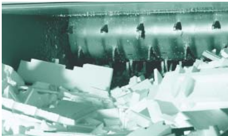
EPS uit bouw- en sloopafval wordt vermalen en direct hergebruikt

Vanaf de jaren '70 is in toenemende mate isolatiemateriaal toegepast in Nederland. Langzaam maar zeker komt een deel van onze gebouwenvoorraad uit die periode in het sloopstadium terecht. Daarbij zullen dus ook isolatiematerialen vrijkomen. Selectief slopen moet er in de toekomst voor zorgen dat ook isolatiematerialen zorgvuldig worden verwijderd om ze via recycling weer een zinvolle bestemming te geven (voor meer informatie over EPS-recycling: zie het deel 'EPS en het Milieu' uit het 'Witboek EPS in de Bouw'). Voor werknemers die bij sloop of renovatie betrokken zijn zal er het een en