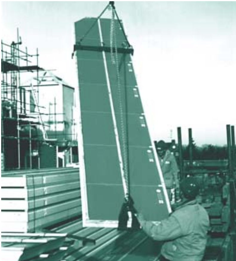
Met de hijsinrichting worden lichamelijke inspanningen op het dak tot een minimum beperkt

'kale' EPS daardoor makkelijk te hanteren, zo nodig eenvoudig op maat te maken en aan te brengen. Ook verwerking van de samengestelde EPS-bouwproducten betekent normaal gesproken geen zware arbeid voor de bouwvakker. Voor de vanwege het hout doorgaans zwaardere dakelementen is een zogenoemde hijsklem ontwikkeld, die ook de productiviteit in positieve zin beïnvloedt. Met behulp van de hijsinrichting worden nagenoeg alle transporthandelingen rond de dakelementen vanaf de grond uitgevoerd.