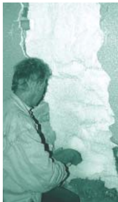
Selectief verwijderen van EPS is een verantwoorde optie voor mens en milieu

Of er, gezien de mogelijke gezondheidseffecten, in de toekomst ook strenge eisen worden gesteld aan het verwijderen van isolatiematerialen, is moeilijk in te schatten. Duidelijk is wel dat uit gezondheidsoptiek voor het verwijderen van EPS geen vrees hoeft te bestaan. Gezien de goede recyclingmogelijkheden van EPS zal selectief slopen zelfs een interessante optie zijn. Maar ook bij het grover slopen zal vrijkomend EPS geen nadelige gezondheidseffecten teweegbrengen.