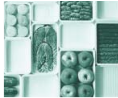
EPS is hygiënisch, non-toxisch en volkomen veilig voor de gezondheid. Niet voor niets wordt EPS vaak als verpakking voor levensmiddelen toegepast

procent [ref 3]. Onderzoek in 1984 maakte al duidelijk dat er hierdoor nauwelijks sprake kan zijn van styreen-emissie uit EPS, en dat eventueel voorkomende monostyreen-sporen zonder enige gezondheidskundige relevantie zijn [ref 4]. Anders gezegd: het mag dus duidelijk zijn dat EPS op dit punt