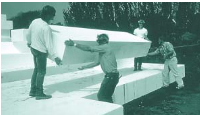
De technische voordelen van EPS zijn inmiddels ook in de grond-, wegen- en waterbouw genoegzaam bekend. Ook het feit dat geen persoonlijke beschermingsmiddelen nodig zijn en EPS licht van gewicht is, wordt als gunstig beschouwd