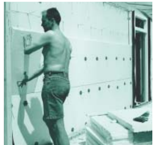
EPS staat alom bekend als een prettig materiaal om mee te werken

Voor EPS zijn geen noemenswaardige preventieve maatregelen geformuleerd. De Stichting Arbow spreekt, in geval EPS wordt bewerkt, een voorkeur uit voor snijden en breken. Gebruik van gloeidraden in de openlucht is uiteraard ook een alternatief. Stof dat eventueel vrijkomt bij het zagen van EPS kan als 'hinderlijk' worden beschouwd en heeft te maken met de daarvoor geldende regels.