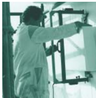
Bij het snijden met een gloeiende draad komt geen stof vrij

Het zagen, snijden, in de spouw plaatsen en het überhaupt aanpakken van bepaalde bouwproducten kan leiden tot irritatie van huid, ogen en luchtwegen en benauwdheid. De mate waarin dat gebeurt is afhankelijk van de wijze waarop men die producten hanteert en de mate van ventilatie. Hoewel dit niet levensbedreigend is, vinden onderzoekers wel dat dergelijk 'alledaags welbevinden' van bouwvakkers aandacht behoeft [ref 11]. EPS staat alom bekend als een prettig materiaal om mee te werken. Het veroor-