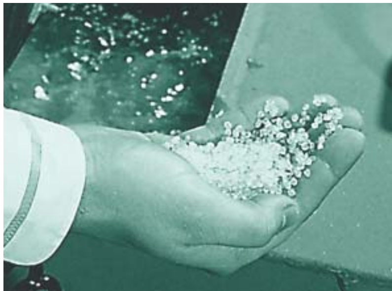
Door de stilstaande lucht in elke afzonderlijke parel verkrijgt EPS haar kenmerkende eigenschappen

De gesloten celstructuur van EPS is overigens niet alleen vanuit het oogpunt van gezondheid gunstig, maar ook vanwege de slechts geringe vochtopname die kan optreden.