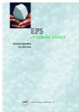
Katern EPS en gezond isoleren

De informatie in deze brochure is een samenvatting van diverse publicaties van Stybenex, de Nederlandse Vereniging van Fabrikanten van EPS®-Bouwproducten. Een uitgebreide beschrijving van EPS en het milieu op basis van wetenschappelijke achtergronden en onderzoeken is verschenen onder de titel 'EPS en het milieu'. Het katern is onderdeel van het 'Witboek EPS in de Bouw; Informatie voor Bouwprofessionals'. Ook het rapport 'EPS en gezond isoleren' maakt deel uit van het Witboek. Informatie over invoerdata van berekening van het milieuvoordeel is opgenomen in de uitgave 'EPS, Milieurelevante productinformatie'. Alle aspecten t.a.v. isoleren met EPS en energie staan beschreven in de twee brochures 'Beter isoleren'. Deze uitgaven zijn op te vragen bij Stybenex.