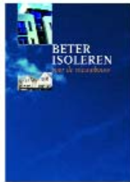
Folder Beter isoleren voor de nieuwbouw