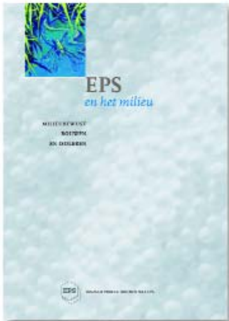
Katern EPS en het milieu

De informatie in deze brochure is een samenvatting van diverse publicaties van Stybenex, de Nederlandse Vereniging van Fabrikanten van EPS®-Bouwproducten. Een uitgebreide beschrijving van EPS en het milieu op basis van wetenschappelijke achtergronden en onderzoeken is verschenen onder de titel 'EPS en het milieu'. Het katern is onderdeel van het 'Witboek EPS in de Bouw; Informatie voor Bouwprofessionals'. Ook het rapport 'EPS en gezond isoleren' maakt deel uit van het Witboek. Informatie over invoerdata van berekening van het milieuvoordeel is opgenomen in de uitgave 'EPS, Milieurelevante productinformatie'. Alle aspecten t.a.v. isoleren met EPS en energie staan beschreven in de twee brochures 'Beter isoleren'. Deze uitgaven zijn op te vragen bij Stybenex.