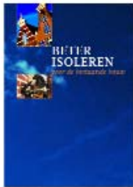
Folder Beter isoleren voor de bestaande bouw