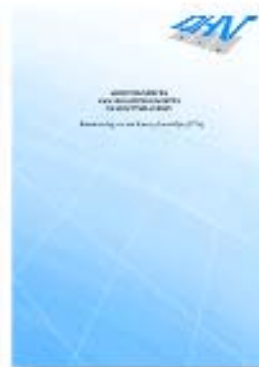
Brochure milieuprofielen (LCA)