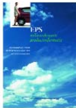
EPS, milieurelevante productinformatie