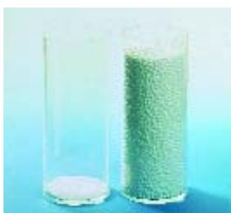
Met slechts 2% grondstof wordt 100% EPS gemaakt